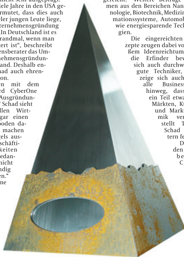
Begehrte Trophäe: der CyberOne- Award.