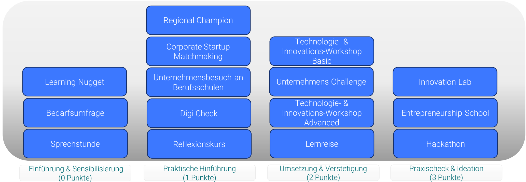
Punktesystem der Lernangebote im Rahmen der Learning Journey